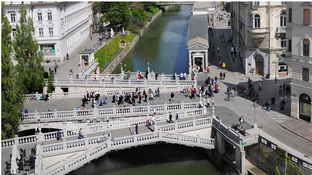
Slika 2: Reka Ljubljanica in Tromostovje

Ljubljana je znana po svoji zeleni podobi. Leta 2016 je prejela laskavi naziv Zelena prestolnica Evrope. Mesto se ponaša s številnimi parki, zelenimi površinami in ohranjeno naravo v neposredni bližini mestnega središča.