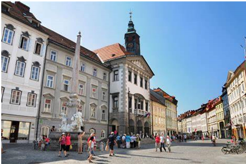
Slika 8: Mestni trg in Rotovž

Na Mestnem trgu stoji Rotovž, mestna hiša z značilno baročno fasado in Robbov vodnjak, eden najlepših baročnih spomenikov v Sloveniji.