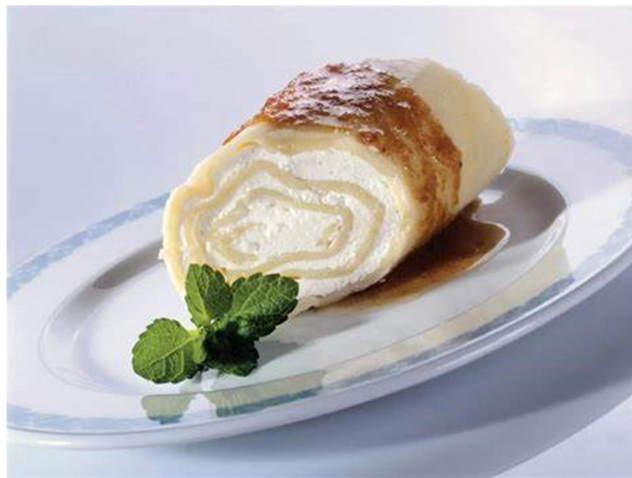
Slika 9: Ljubljanski štruklji

Med tem odsekom bomo spoznali zgodovino in zgodbe štrukljev, različne načine priprave in njihovo pomembnost v slovenski kulinariki. Poskusili bomo štruklje z različnimi nadevi, sladkimi in slanimi.