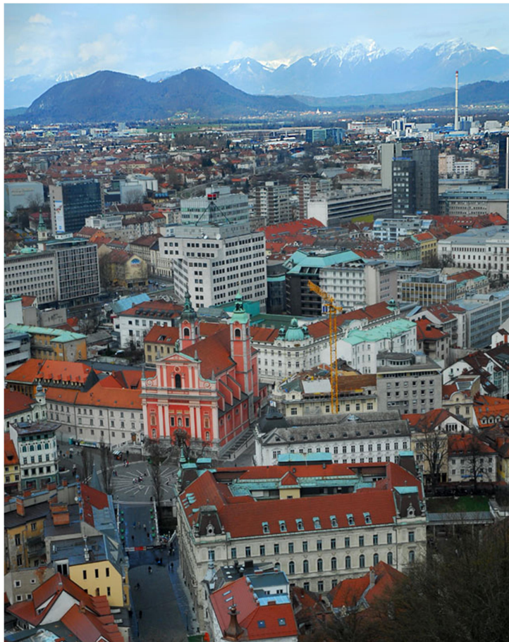
Slika 6: Razgled s stolpa Ljubljanskega gradu

Razgledni stolp Ljubljanskega gradu ponuja panoramski pogled na Ljubljano in njeno okolico. Z vrha stolpa bodo gostje občudovali slikovito staro mestno jedro, reko Ljubljanico, okoliške hribe in Julijske Alpe ter najvišjo goro Slovenije - Triglav, ki je tudi eden izmed slovenskih simbolov.