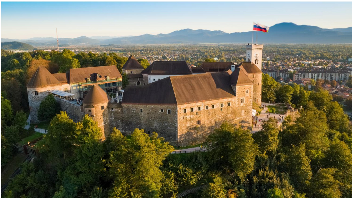
Slika 5: Ljubljanski grad

Grad ima bogato zgodovino, saj je bil skozi stoletja pomembno strateško in upravno središče. Danes je priljubljena turistična točka, ki ponuja raznolike vsebine, od muzejskih razstav do kulturnih dogodkov.