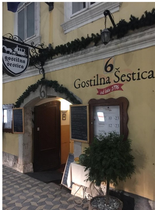
Slika 10: Tradicionalna slovenska gostilna

Na koncu našega vodenja se bomo prepustili kulinaričnemu razvajanju v eni od starih tradicionalnih ljubljanskih gostiln, Gostilni Šestica. Njena tradicija sega že v 18. stoletje. Tam bomo imeli rezervirano mizo in priložnost, da poskusimo različne okusne slovenske jedi in lokalna vina. V prijetnem vzdušju bomo lahko izmenjali vtise o našem doživetju in uživali v tradicionalnih okusih Slovenije različnih gastronomskih regij.