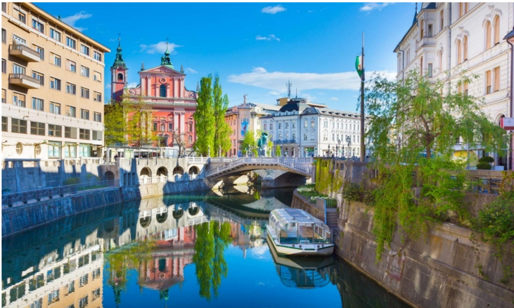
Slika 1: Ljubljana

Mestna občina Ljubljana, gospodarsko, kulturno, izobraževalno in upravno središče Slovenije, se razprostira na 163,8 km 2 in leži na pomembnem stičišču prometnih poti, ki povezujejo različne dele države in širše regije. Mesto se je razvilo ob reki Ljubljanici, ki s svojimi številnimi mostovi in slikovitimi bregovi daje mestu poseben čar.