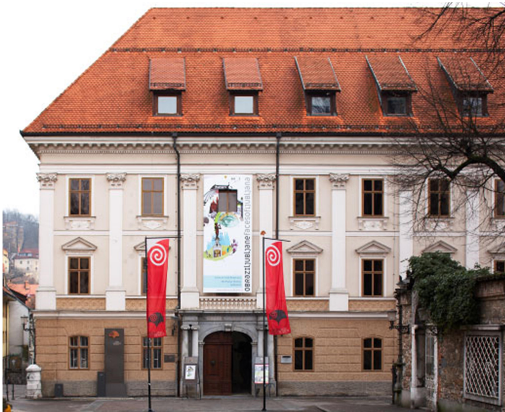
Slika 4: Mestni muzej Ljubljana

Na tej lokaciji se bodo gostje udeležili enourne ustvarjalne delavnice, ki bo prilagojena različnim interesom in starostnim skupinam. Na voljo bodo različne možnosti, kot so izdelava spominkov z ljubljanskimi motivi, likovne delavnice ali spoznavanje tradicionalnih rokodelskih tehnik. Delavnica bo priložnost za sprostitev, ustvarjalno izražanje in povezovanje z drugimi udeleženci.